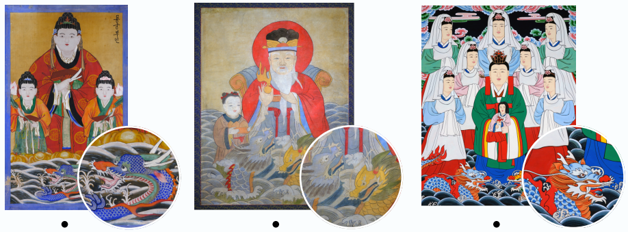
개양할미도 용왕도 용궁부인도

2존에 있는 유물에서 용을 찾아볼 수 있어요. 용이 숨어 있는 유물의 이름을 맞춰보세요